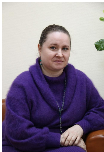
Высшая школа менеджмента "Менеджмент организации"